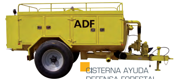
CISTERNA AYUDA DEFENSA FORESTAL