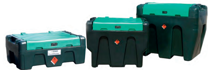
DEPOSITOS GRG PARA COMBUSTIBLE