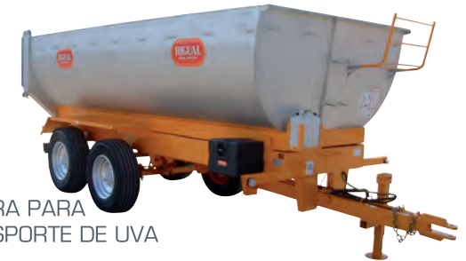
BAÑERA PARA TRANSPORTE DE UVA